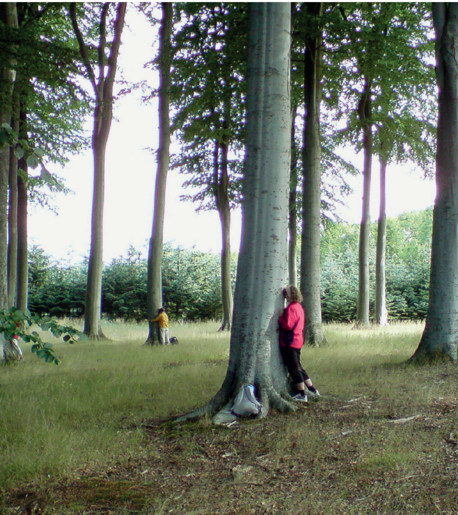
I "den hemmelige bøgelund" er der både jordforbindelse og højt til loftet. Hver finder sit eget krafttræ.

strukturer varierer meget i størrelse. Fx strækker Tyrens linje sig flere tusinde km fra rodchakraet i Nordafrika til kronchakraet i Jotunheimen i Norge, mens klippeformationen Externstein i Nordtyskland bare er 100 m.