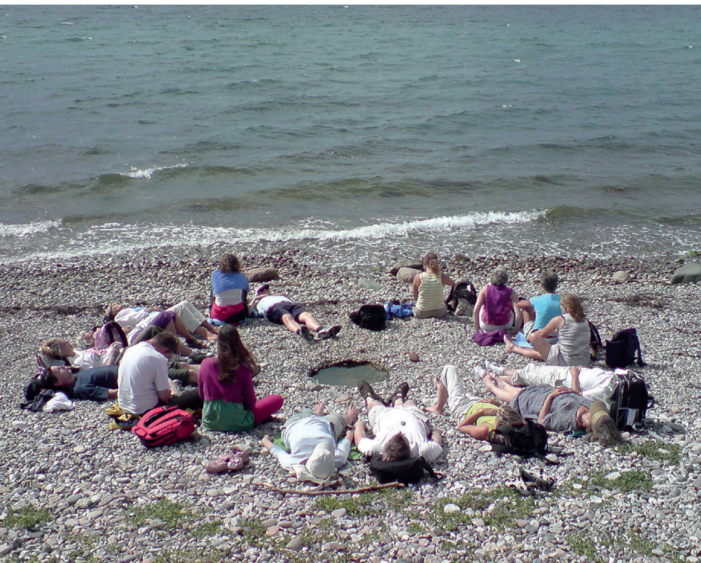
Omkring Ilsemade helligkilde, som ligger få meter fra strandkanten, laver vi meditationer og øvelser, der relaterer til sakralchakraet.